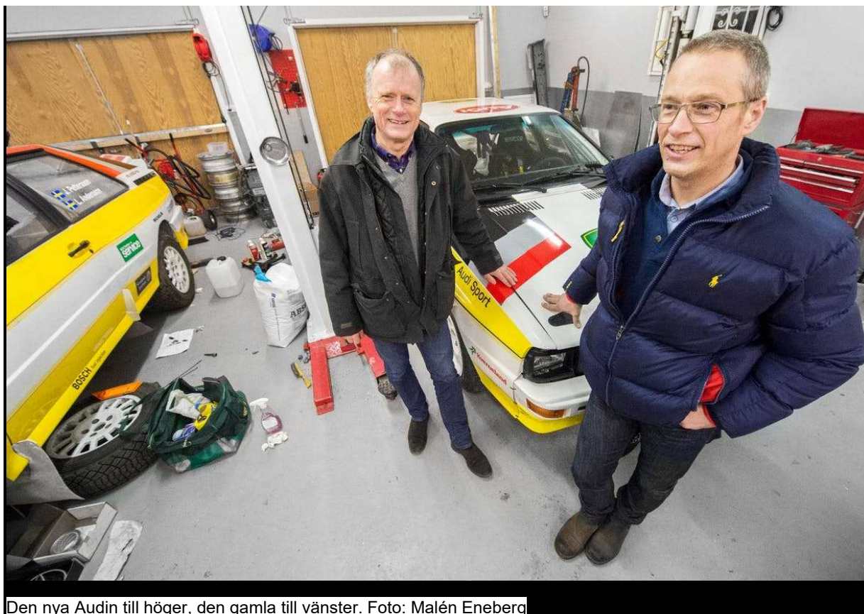
Den nya Audin till höger, den gamla till vänster.

Duons tidigare Audi som fortfarande står intill duons nyförvärv i Jannes garage är första generationens rallyquattro. Nykomlingen får sägas vara version 2.0, 1983 års modell för att vara exakt.